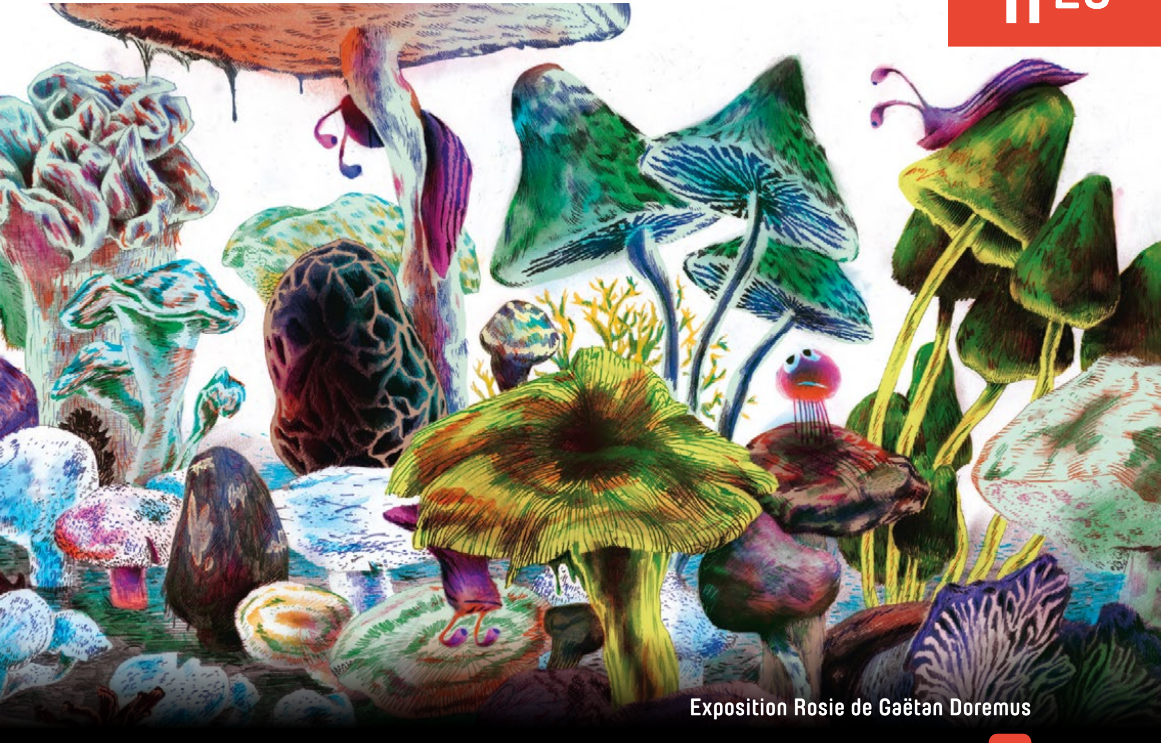
Exposition Rosie de Gaëtan Doremus

Pour ce printemps 2024, les médiathèques vous ont réservé de belles surprises avec des auteurs-illustrateurs de la littérature adulte et jeunesse: des rencontres, une exposition d'originaux et le premier salon du livre à Champigny dédié à l'illustration, le samedi 25 mai 2024.