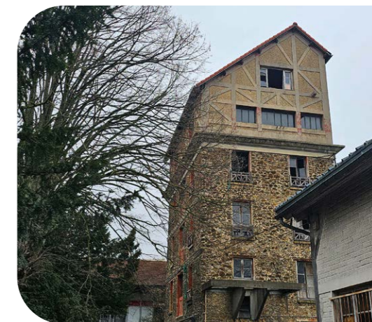
Le moulin de Champigny, au cœur du nouveau projet du Moulin des arts, boulevard de Stalingrad

Parmi les nouveaux projets, en particulier les futurs pôles, la Ville projette de transformer un site délaissé, sur la friche du Moulin, boulevard de Stalingrad, en un véritable lieu de vie dédié à la création. Le Moulin des arts réunira artistes plasticiens, ateliers et espaces d'exposition, en lien avec l'ACAP 94, pour favoriser les échanges et la diffusion artistique. Pensé comme un pôle ouvert, il devrait accueillir aussi une résidence seniors et le magasin Boesner (actuellement installé au Plant-Tremblay). Une reconversion ambitieuse, un nouveau cœur culturel à Champigny!